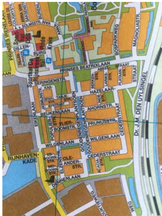
Alphen aan de Rijn

(De Magnoliastraat ligt net buiten het beschreven blok.) Het is een goed verzorgde buurt met veel groen. In het midden bevindt zich het Goudenregenplantsoen langs een watergang – hier staan onder andere enkele reusachtige populieren. Vrijwel alle straten hebben boombeplanting, meestal niet de soorten van de vernoeming. Zo staan langs de Hazelaar jonge amberbomen. Echter, in de Ahornstraat staan esdoorns (Ahorn), in de korte Lindestraat twee jonge lindes en langs de Wilgenlaan (ook met water) staat een prachtige oude treurwilg. De architectuur is gemengd en stamt grotendeels uit de jaren '70 en '80: rijtjeshuizen, flats en enkele geschakelde villa's. Recent zijn ook nieuwe appartementsgebouwen verschenen. Van de 24 straten hebben negentien daadwerkelijk het achtervoegsel -straat, vier hebben -laan (en de bomen in het meervoud!) en er is een plantsoen.