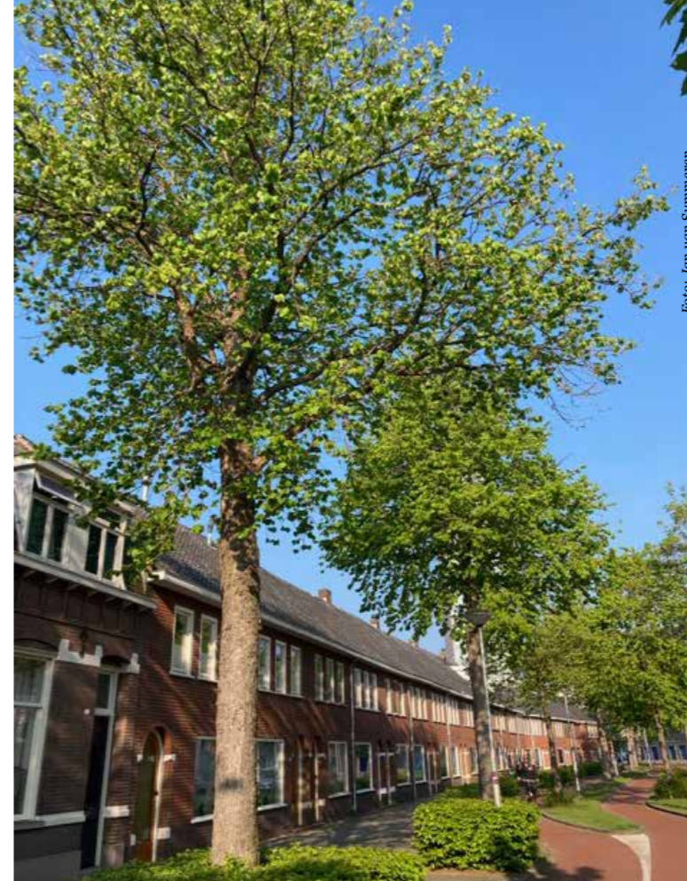
Boomhazelaars in de Boomstraat te Tilburg

Tilburg (Noord-Brabant) heeft een vrij grote bomenbuurt dicht bij het centrum: tussen de Hart van Brabantlaan, Noordhoekring, Bredaseweg en Ringbaan-West. Arbeiders- en middenstandswoningen uit de eerste helft van de 20e eeuw domineren, maar in het westen is veel nieuwbouw