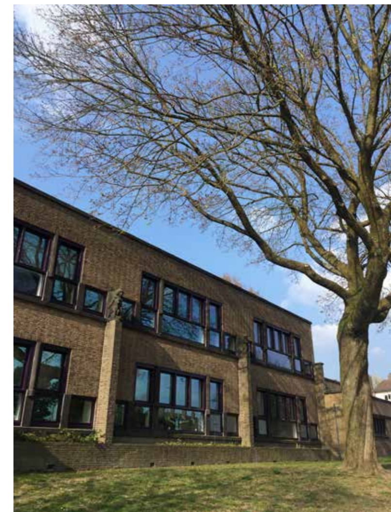
Monumentale esdoorn in Arnhem op de kruising van de Dennenweg en de Populierstraat-

In Arnhem-Zuid (Malburgen-West) is een kleine bomenbuurt met vernoeming van elzen, wilgen,