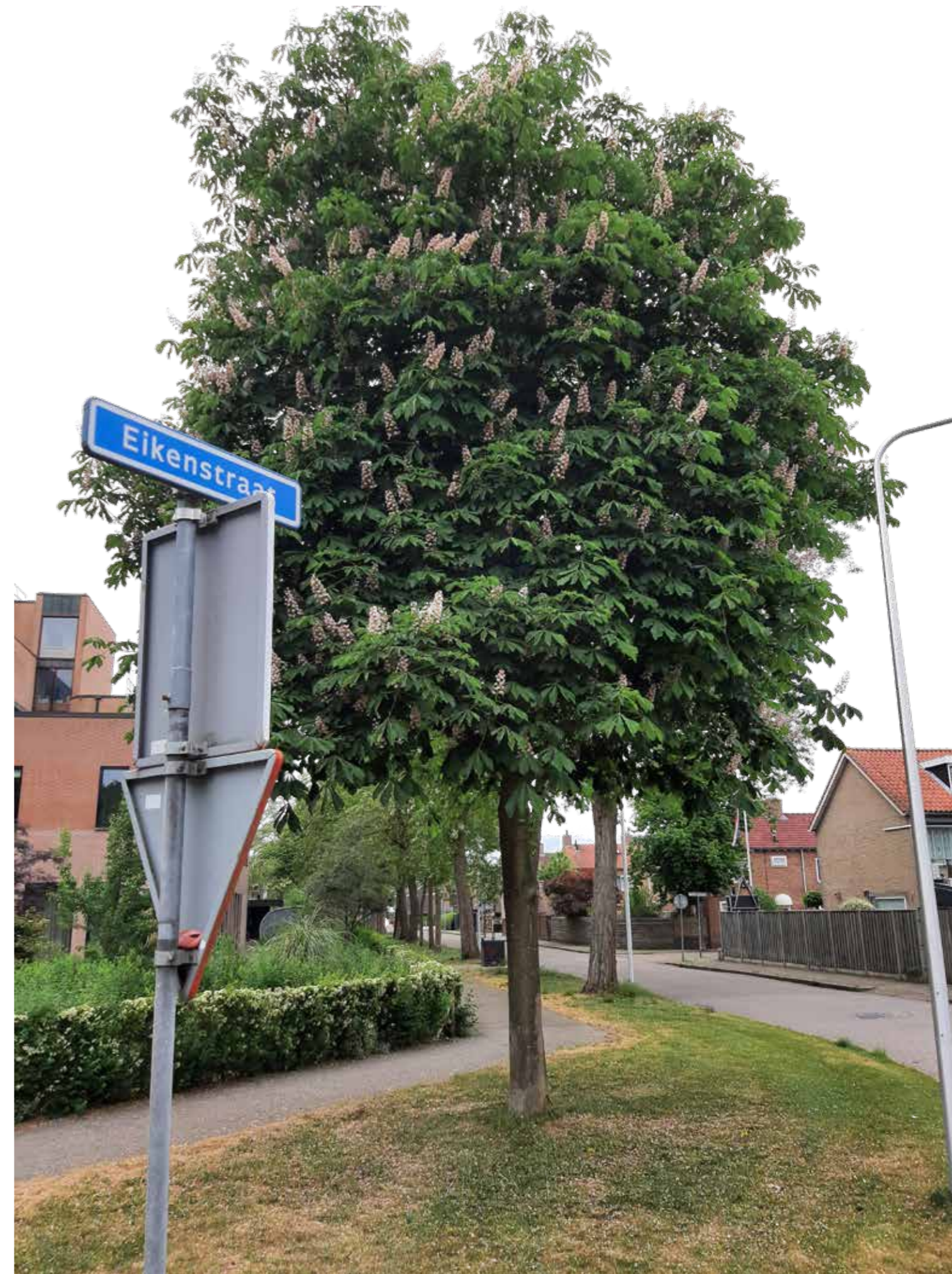
In de Eikenstraat in Zwolle staan paardenkastanjes.

Mijn dank gaat uit naar de contactpersonen in de vijf voorbeeldgemeenten. Dit straatnamenonderzoek is onvolledig en zeker niet foutloos. Opmerkingen en aanvullingen zijn daarom welkom! (naar aartdeveer@casema.nl) Er moeten immers meer verhalen zijn van mensen die in een bomenbuurt wonen. 🌳